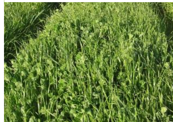
Ray-grass d'Italie + trèfle incarnat ALDO: