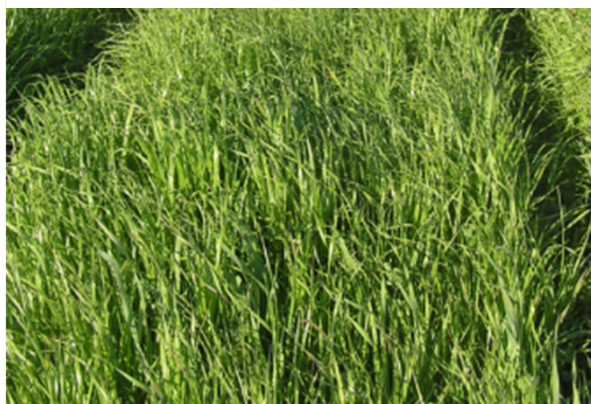
Ray-grass d'Italie + trèfle incarnat KARDINAL:

Mesure du taux final de trèfle incarnat dans le mélange fourrager en fonction de la variété